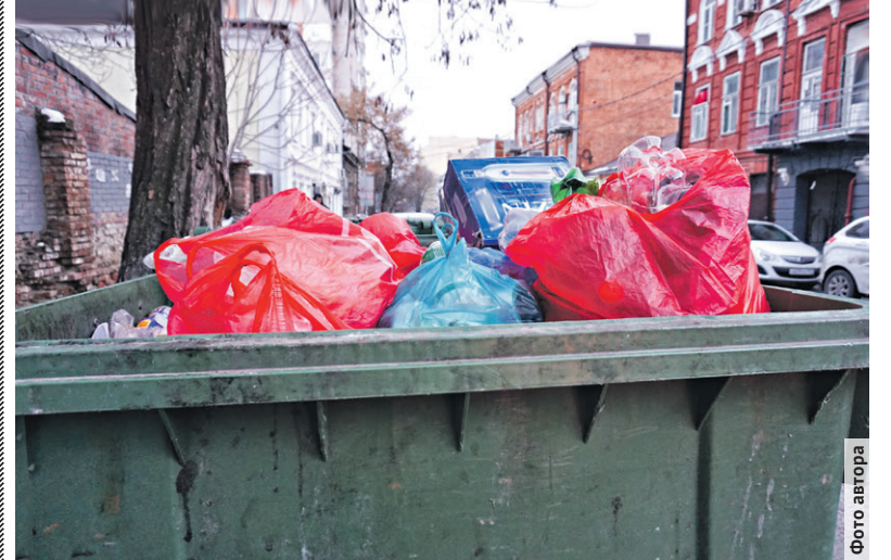
Готовы ли жители области собирать мусор раздельно...